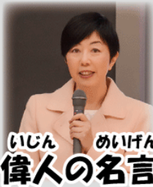
いじん めいげん 偉人の名言

いま よ ちから やしな みなさんも今のうちにしっかり「読む力」を養ってくださいね！