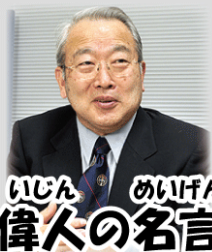
いじん めいげん 偉人の名言

い はや ていねい だいいち きも いま いつも言っているように「速さよりも丁寧さを第一に」の気持ちで、今 いじょう しんけん と く くだ まで以上に真剣に取り組むようにして下さいね。