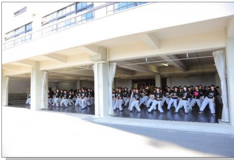
大人数で練習に励む部員たち