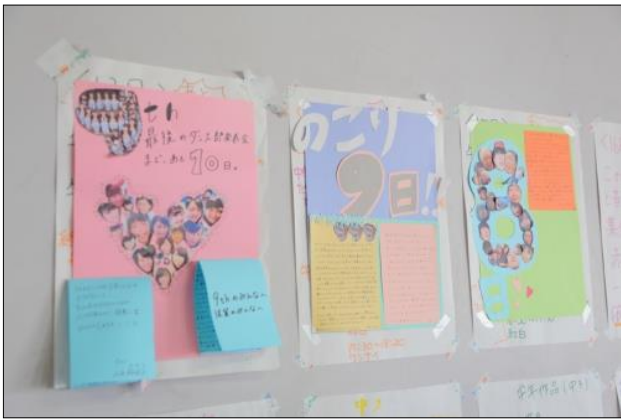
掲示物で全員が共有の課題として意識

しかし、同志社香里高校のダンス部は理想的とも言える「自分たちで考え、実行し、 結果を出す」ということに成功しました。恐らく彼女たちは部活動を通じて、他の高校 生たちよりも、より高いレベルで自主性、協調性、責任感、連帯感、そしてコミュニケ ーション能力を伸ばすことが出来ているのではないのでしょうか。